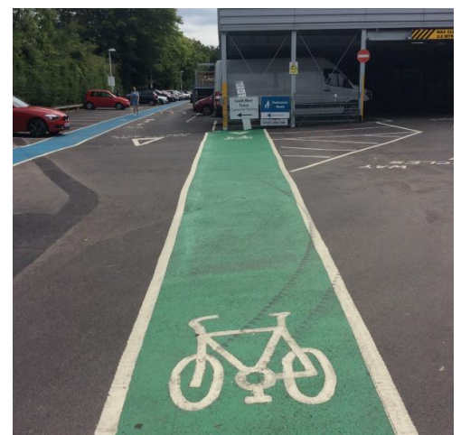
Teststrecke für Fahrradhelme ?

Alte Rundbriefe unter www.adfc-burgwedel.de/?page_id=739