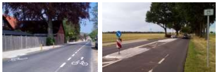
Ortseinfahrten in KBW