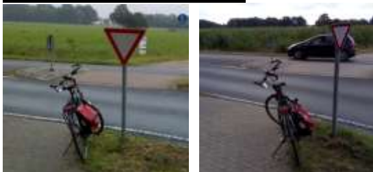
Gefährliches Schild entschärft (GBW)